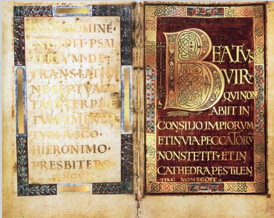
Dagulf-Psalter, 8.Jh. (Wien, Österreichische Nationalbibliothek, Cod. 1861)